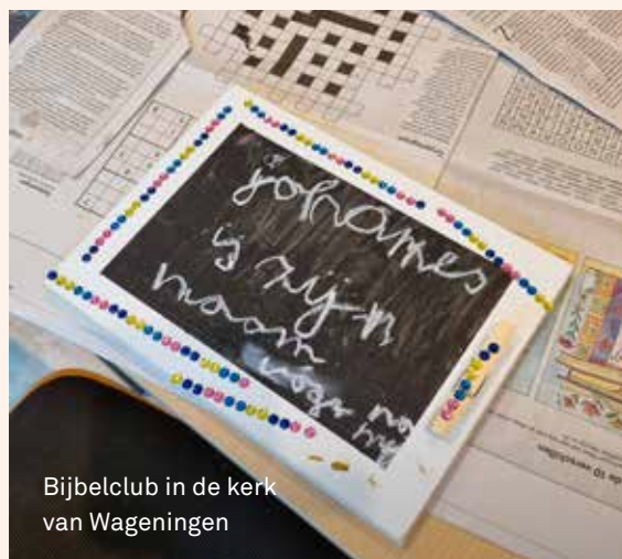
Bijbelclub in de kerk van Wageningen

denken er soms over een groep voor twaalflussers te beginnen.'