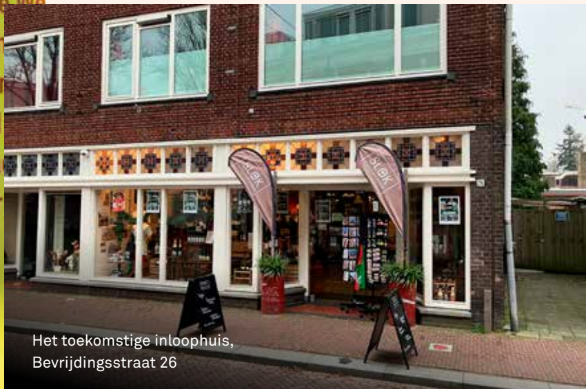
Het toekomstige inloophuis, Bevrijdingsstraat 26

bloemschikken, autowassen en een creatieve ochtend. Bij de lunch gaat dan de Bijbel open. Een aantal buurtbewoners komt naar de verkoping van de vrouwenvereniging. Ook daar ligt evangelisatiemateriaal. 'Van tevoren verspreiden we waardebonnen in de buurt, waardoor mensen worden uitgenodigd.' Met de bewoners van de sociale huurwoningen ontstaat gemakkelijk contact. Lastiger is het bij de duurdere huizen in de nieuwbouwwijk achter de kerk. 'Op veel brievenbussen zit daar een nee-neesticker, zodat we er geen folders kunnen bezorgen. Veel kinderen uit die wijk zitten op een sportclub. Hen krijgen we niet warm voor onze kinderbijbelclub.'