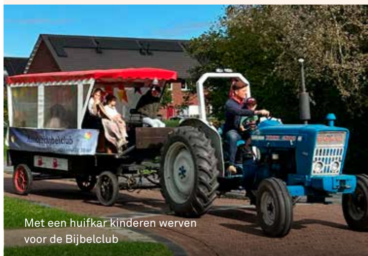
Met een huifkar kinderen werven voor de Bijbelclub