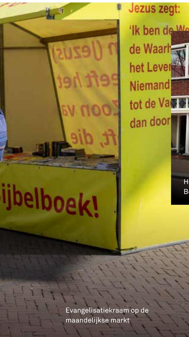
Evangelisatiekraam op de maandelijkse markt